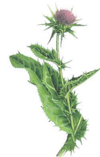
Mariendistel ( Silybum marianum )

und Bauchspeicheldrüse. Sie aktiviert den Gallenfluss, wodurch die Verdaulichkeit der Fette verbessert wird. Im Leber-Supplement verarbeiten wir Mariendistel; sie wird traditionell zur Unterstützung der Leberfunktion und zur Ausleitung eingesetzt. Curcuma ergänzt sich hervorragend mit Mariendistel und stimuliert dazu den Gallenfluss zur Fettverdauung.