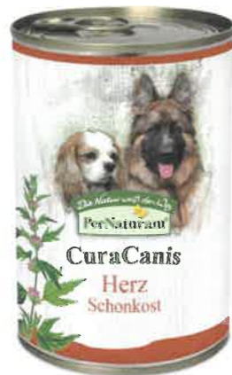
CuraCanis Herz 6 x 400 g · 21,60 €

Durch unsere Gemüsemischung versorgen wir den Herzmuskel mit Mineralstoffen und Spurenelementen, insbesondere Folsäure, Kalium und Magnesium. Das Lycopin aus der Tomate zählt mit zu den aktivsten Antioxidantien; es neutralisiert freie Radikale im Körper und beugt dadurch Entzündungsreaktionen vor. Brokkoli unterstützt mit seinem hohen Gehalt an Chlorophyll die Blutbildung und verbessert die Leistungsfähigkeit des Herzens. Im Supplement sorgt Moringa mit ihrem hohen Gehalt an Antioxidantien und Mineralstoffen für eine Entlastung des müden Kreislaufs. Weißdorn, Herzgespannkräut und Melisse haben sich traditionell bei Herz- und Kreislaufbeschwerden bewährt.