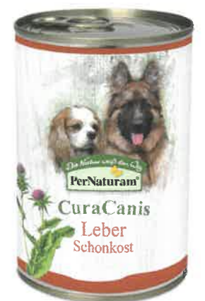
CuraCanis Leber 6 x 400 g - 21,60 €

Wenn Sie Fragen haben, rufen Sie uns einfach an (0 67 62 / 96 36 2 - 299) oder schreiben Sie uns eine E-Mail an beraterteam@pernaturam.de .