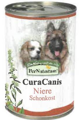
CuraCanis Niere 6 x 400 g - 21,60 €

Als nötige Ballaststoffquelle ist Gemüse in der Dose enthalten. Hier haben wir uns für Birkenblätter, Goldrute und Löwenzahn entschieden. Diese Pflanzen verbessern die Aquarese, das heißt, sie erhöhen die Harnmenge, ohne dabei Mineralstoffe aus dem Körper auszuschwemmen. Die erhöhte Harnmenge hilft, Nieren und Blase besser zu durchspülen und verhindert, dass sich Keime in der Blase einnisten. Die Goldrute sorgt für eine bessere Durchblutung im Nieren- und Blasenbereich, sie stärkt Nierengewebe und die Schleimhäute der Blase und hilft, unerwünschte Keime besser auszuspülen. Diese Wirkung wird mit dem Nieren-Supplement verstärkt.