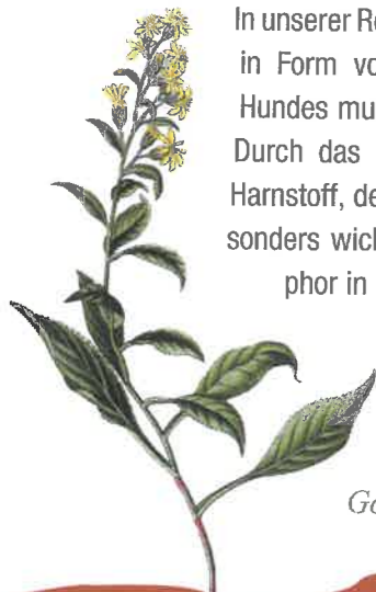
Goldrute ( Solidago virgaurea )

In unserer Rezeptur setzen wir hochwertige Proteine in Form von Muskelfleisch ein; der Bedarf des Hundes muss dabei so gerade eben gedeckt sein. Durch das hochwertige Protein entsteht weniger Harnstoff, der die Nieren belasten würde. Ganz besonders wichtig ist der verringerte Anteil an Phosphor in der Fütterung. Daher setzen wir Algenkalk statt Fleischknochenmehl ein. Der etwas höhere Fettgehalt dient als Kalorienquelle.